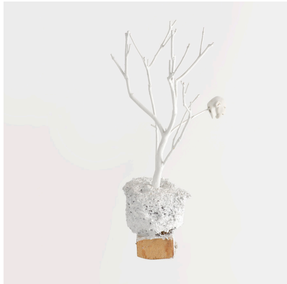
Ser , 1999-2021 Madera, porcelana y esmalte 44 x 26 x 21 cm