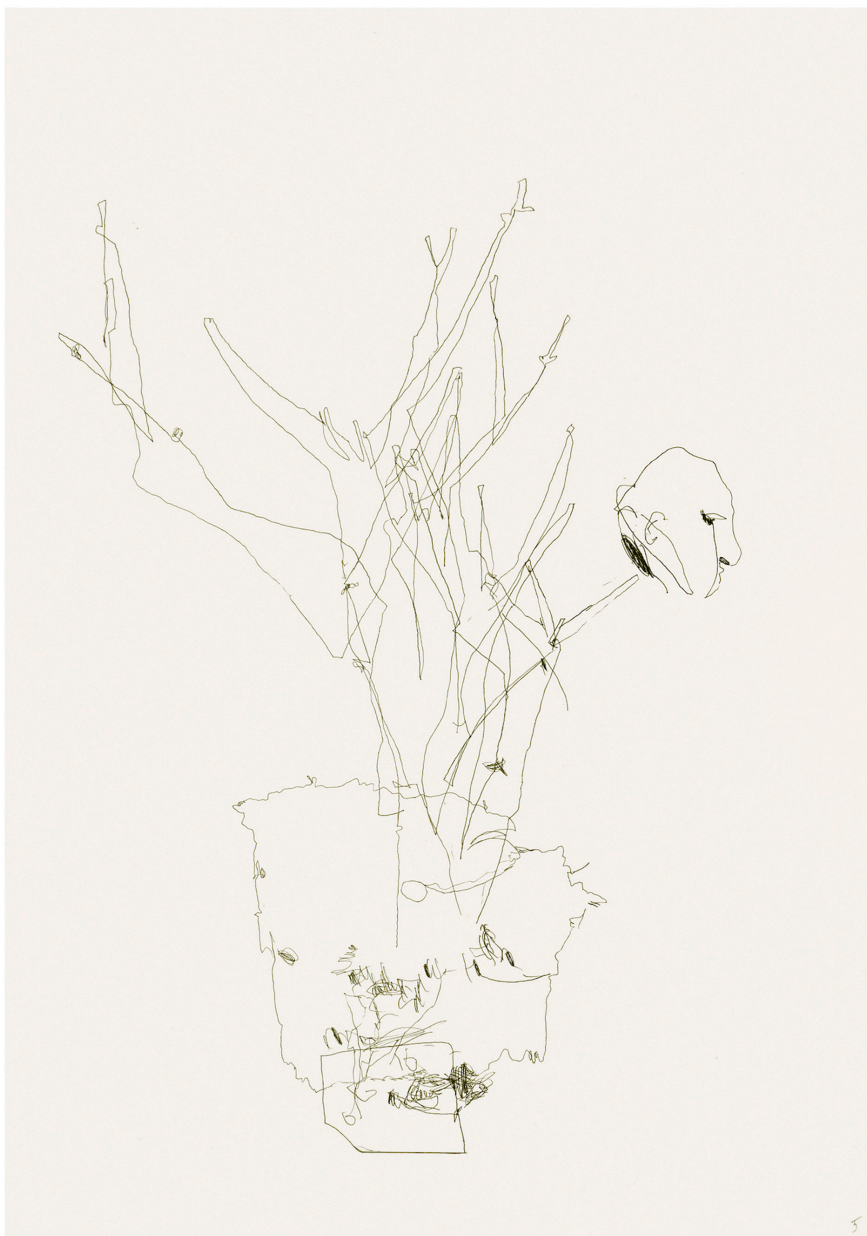
Dibujos ciegos, 2021 (serie de 19 dibujos) Carbón sobre papel 42 x 29,7 cm c/u