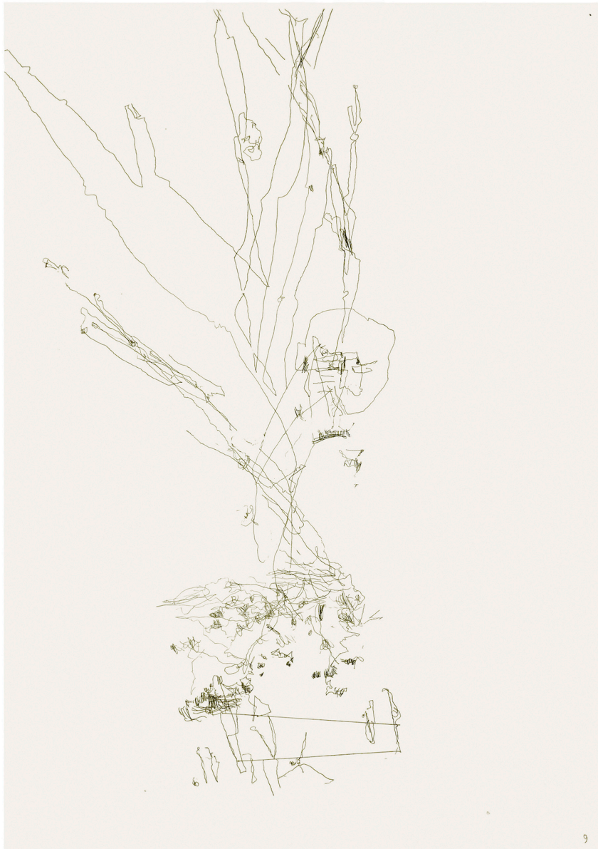
Dibujos ciegos, 2021 (serie de 19 dibujos) Carbón sobre papel 42 x 29,7 cm c/u