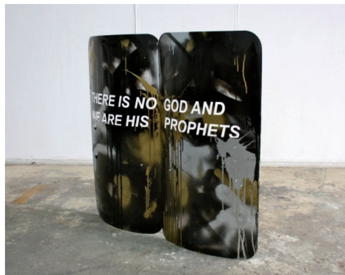
Avelino Sala. "For the future for the unborn". Escudo antidisturbios intervenido y soporte de hierro. 90 x 60 x 15 cm. 2016.

Gaur Konstelazioak - Kairós San Telmo Museoa (San Sebastián) 23/01/16_15/05/16