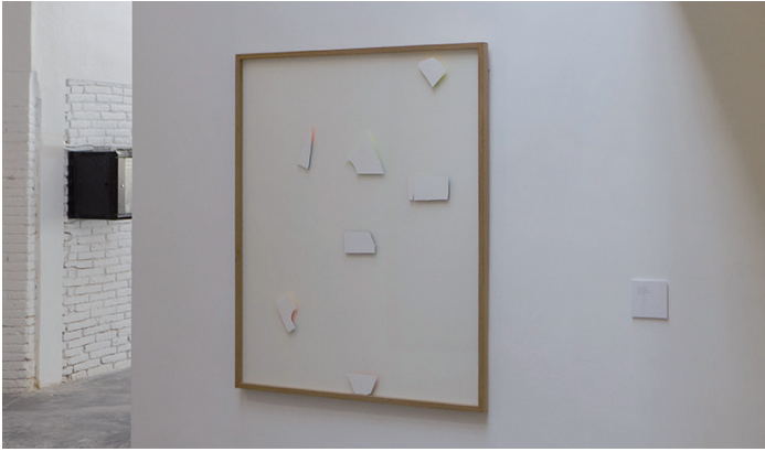
Guillermo Pfaff. Vista de la exposició "Lighting" en la Galeria Carles Taché. 2016.