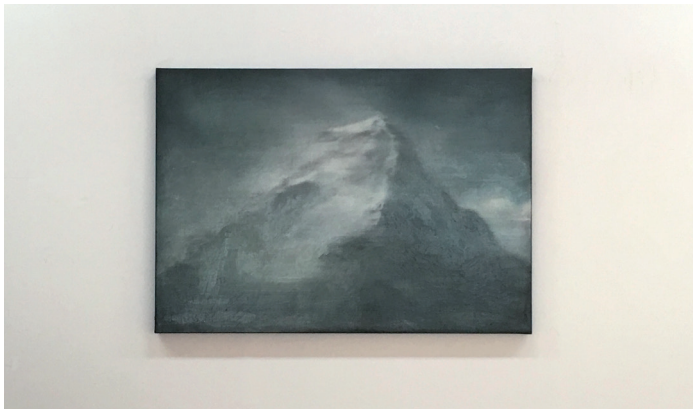
Eduard Resbier. "Everest". Oli sobre tela. 2015.