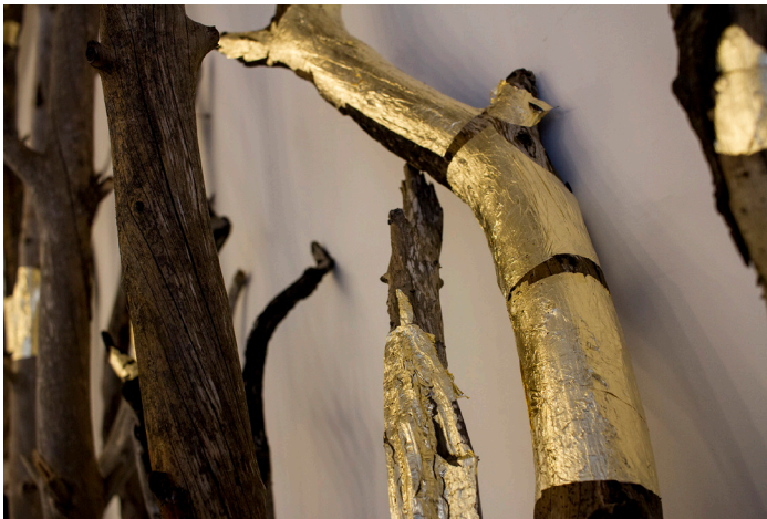
Tono Carbajo. "El Bosque de Kintsugi" (detalle). Video instalación. 3 x 10 m. Marzo de 2017.