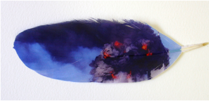
Avelino Sala. Twin Towers. Tintas UVI sobre pluma de pato. 18 x 20 x 2 cm. 2017.