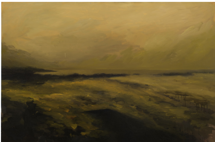
Marco Noris. Allá donde las playas rotas nos muestran el cielo. Oli sobre llenç, 145 x 180 cm. 2017.