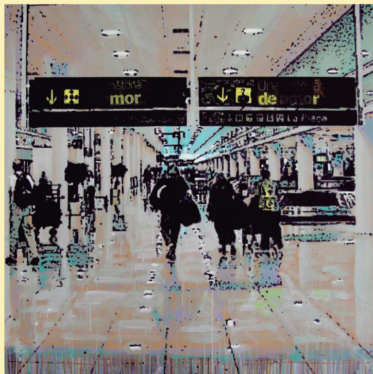
Lapsus, 2013, acrílic i collage sobre tela, 120 x 120 cm.

Els "no llocs" com aeroports o estacions de tren s'han convertit en protagonistes de Quiosc Gallery durant els tres mesos que ha durat l'exposició.