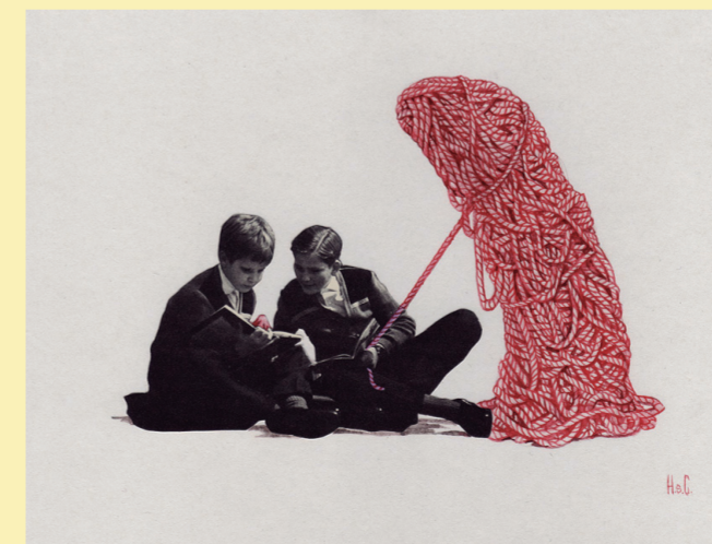
A pesar de tu edad, 2012, acuarela y collage, 21 x 16 cm.