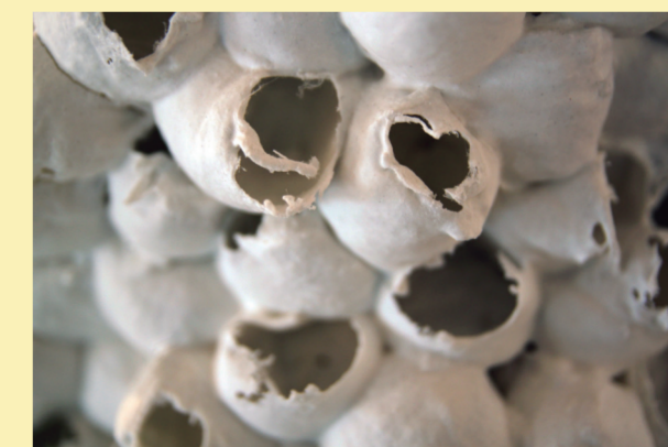
Innerspace, 2012, Porcellana, monococció a 1250°C. 45 x 45 x 65 cm