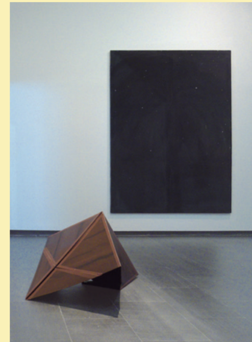
Centro de Arte Dos de Mayo (CA2M)