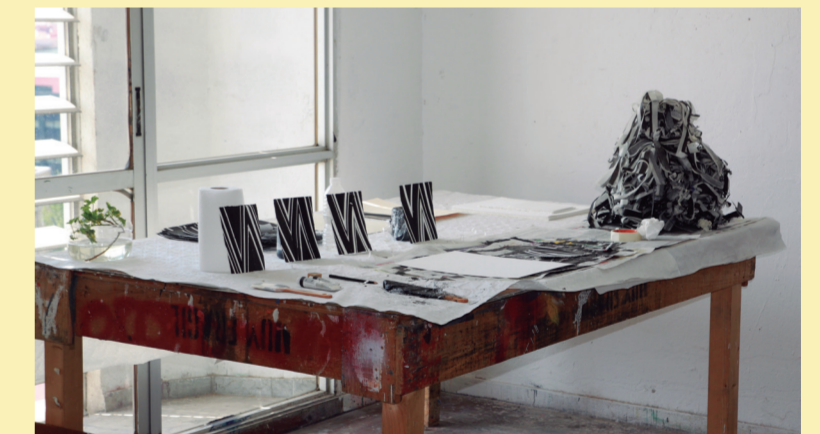
Estudio de David Rhodes

obligan al espectador a inspeccionar, paulatinamente, cada una de sus formas.