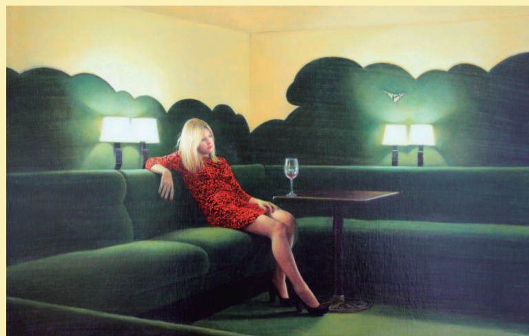
Ana, 2012, óleo sobre tela, 73 x 115 cm.

Estefanía Urrutia (Madrid, 1981) ha inaugurado recientemente la exposición 'Giardinetto Stories' en la Galería Miquel Alzueta (Barcelona), que se podrá visitar hasta el día 12 de julio. En la exposición individual 'Luz', realizada a finales del 2012 en nuestro centro de arte, Urrutia ya insinuaba la trazas de su nueva serie en dos de sus obras. // Giardinetto como escenario y el verde